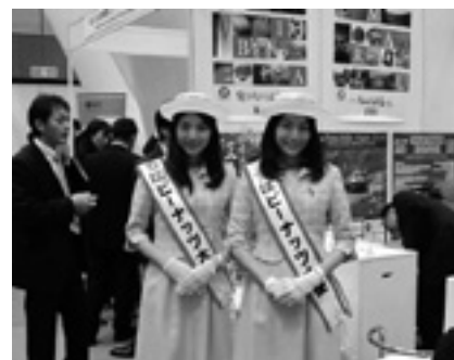
「ちばビーナッツ大使」も登場

今回は、平成22年9月に国際会議観光都市に認定された浦安市と協働出展。ちば国際コンベンションビューローのブースには226名ものMICE関係者が訪れ、MICE開催地としての千葉を大いにPRすることができました。