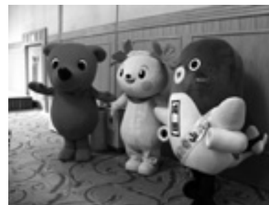
チーパクくん、きみびょん、うなりくんも登場