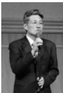
観光庁 岩本参事官

皆様におかれましては、今後も人的ネットワークの構築及びビジネスの機会拡大のため、当財団の会員交流会や主催者セミナーなどをお役立てください。