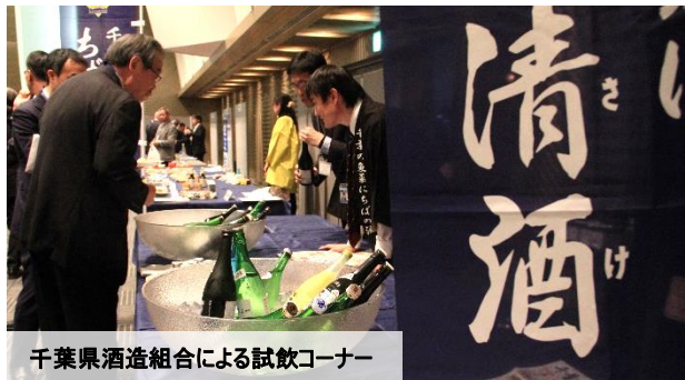
千葉県酒造組合による試飲コーナー