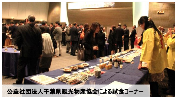
公益社団法人千葉県観光物産協会による試食コーナー