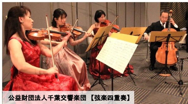
公益財団法人千葉交響楽団 【弦楽四重奏】